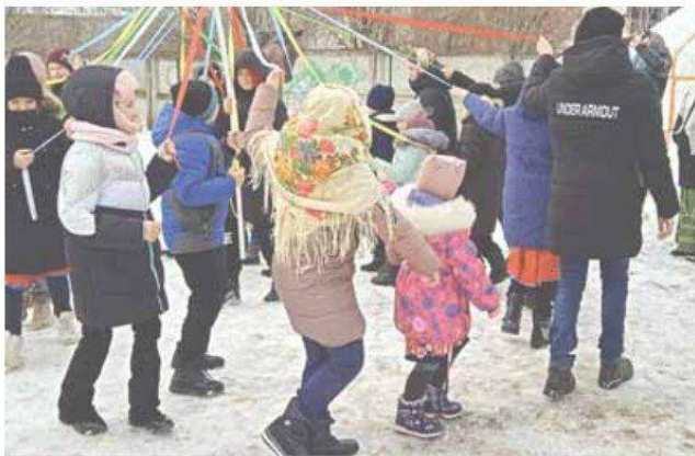
На территории «Дикого поля» дети и взрослые водили хоровод с лентами

В уголке крестьянского быта детей и взрослых познакомили с предметами хозяйственного обихода в крестьянских избах — ступой, ухватом, коромыслом, деревянными ложками, ткацким станком — и показали, как ими пользоваться. Дети растерали овсянку в ступе, ухватом поднимали